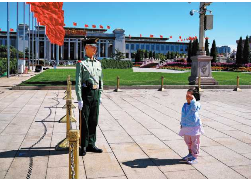
《致敬》 吕俊姣 摄影