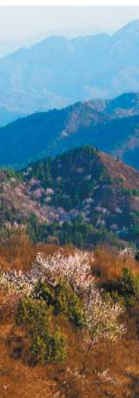
《祖国万岁》