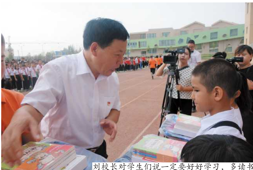
刘校长对学生们说一定要好好学习，多读书

经过紧张的前期筹备，8月21日，北京市慈善协会“慈善童行之开学礼物”在腾讯公益平台如期上线，开始了网上筹款。