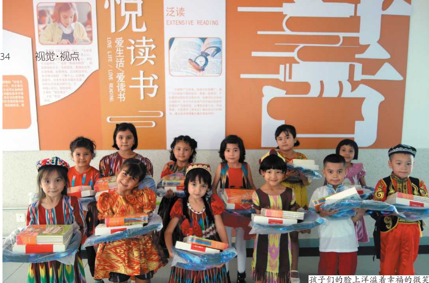
孩子们的脸上洋溢着幸福的微笑