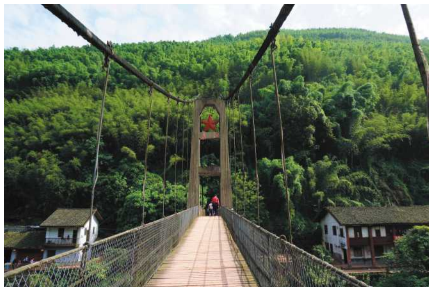
《不忘长征路》