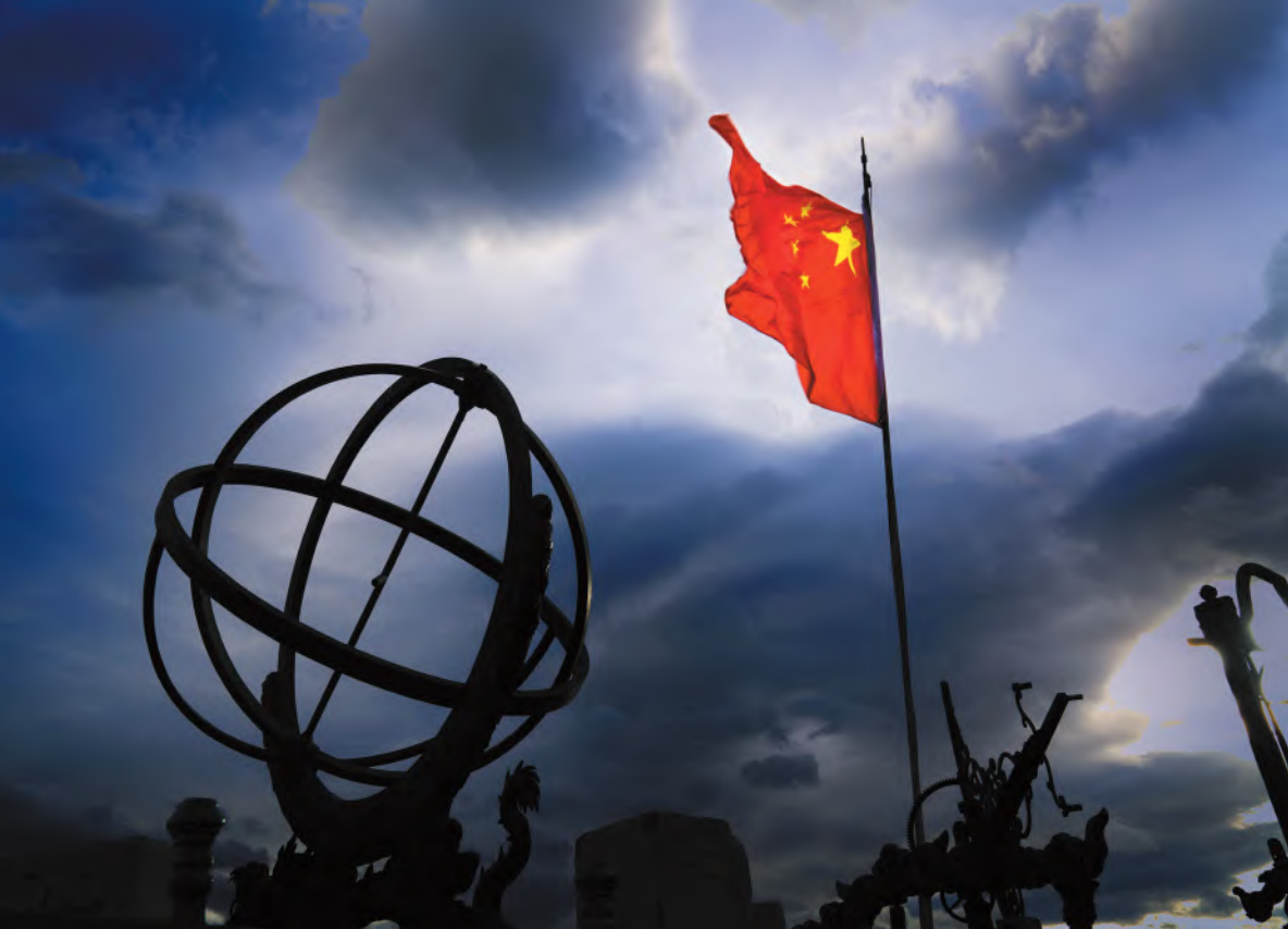
《历史的见证》