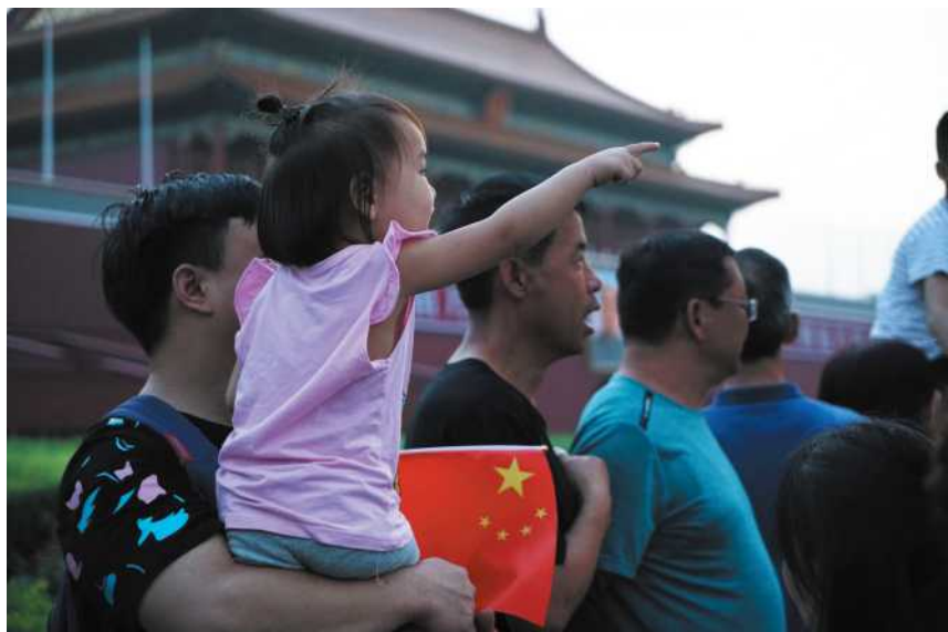
《观看升国旗》