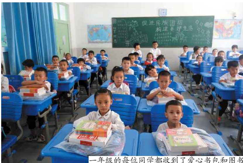
一年级的每位同学都收到了爱心书包和图书

协会领导对项目十分重视，组织开展了多种宣传推广活动，五天的时间就从网上筹募到60016.79元善款，参与捐款人数达16876人，创下协会网上筹款速度最快，日均捐赠量最高的记录。