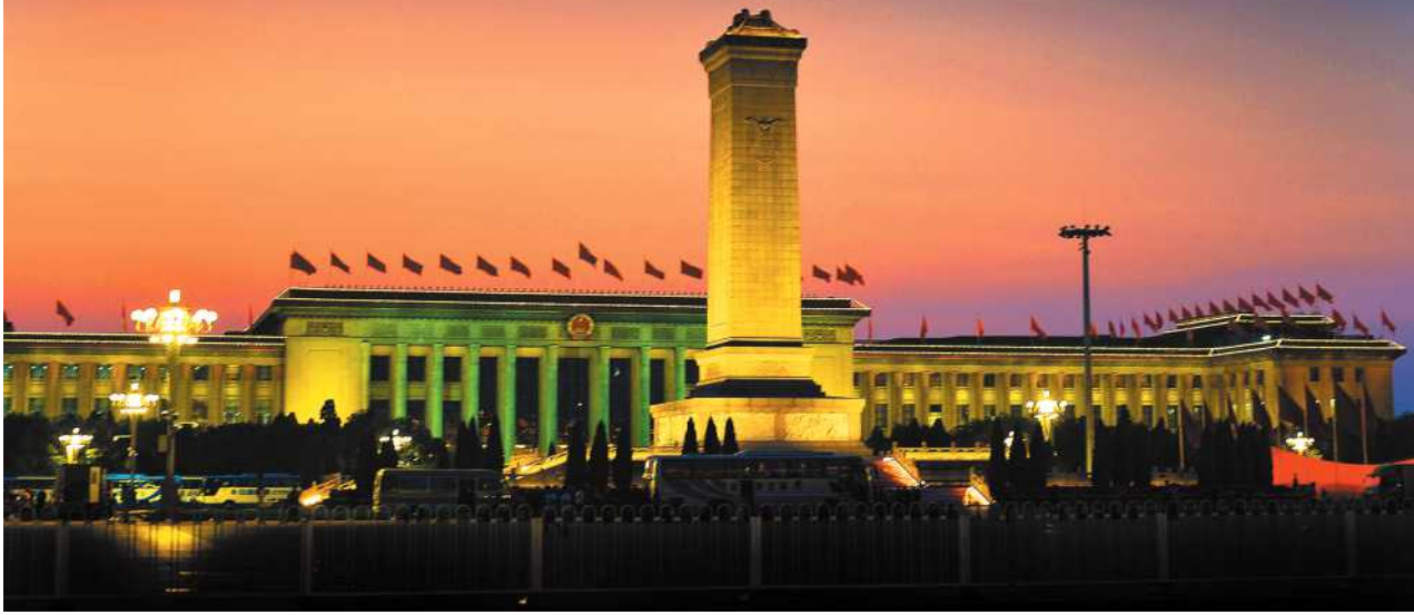
《人民英雄纪念碑》 孟昭禄 摄影