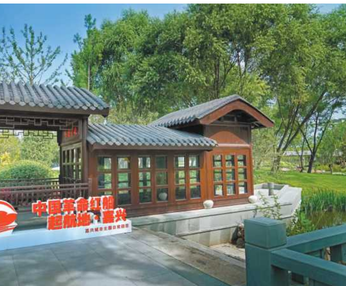
《中国革命起航船》